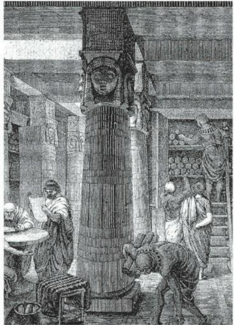
De Bibliotheca Alexandrina in Alexandrië en een 19de-eeuwse impressie van zijn wereldvermaarde voorganger uit de Oudheid.