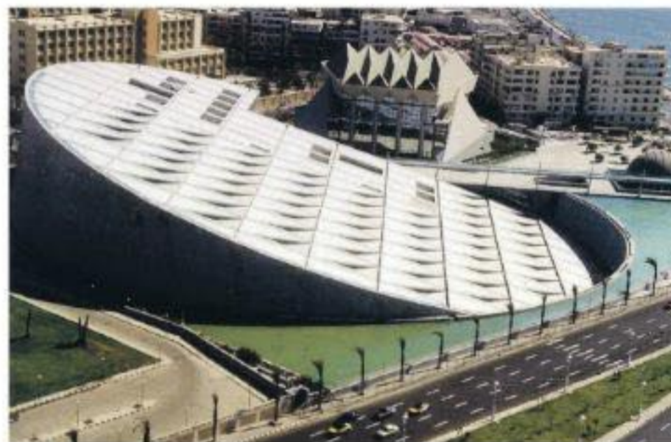
De Bibliotheca Alexandrina werd in 2002 geopend.

In 2002 liet Egypte met steun van Unesco de Bibliotheca Alexandrina uit de as herrijzen, een hypermodern gebouw vlak bij de plek waar deze in de oudheid zou zijn gesticht. Landen buitelden over elkaar heen om het project te steunen. Uit de Arabische wereld kwam 64 miljoen dollar (46 miljoen euro) aan donaties. De grootste mecenas was Saddam Hoessein, met 21 miljoen dollar.